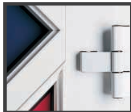
① Haustüren der Serie Exclusiv und TOP sind mit massiven, verstellbaren Bändern ausgestattet.

Knipping-Haustüren können mit allen gängigen Sicherheitsgläsern ausgestattet werden. Auch die Füllungen sind in unterschiedlichen Sicherheitsstufen lieferbar: von A 3 (durchwurfhemmend) bis B 2 (durchbruchhemmend).