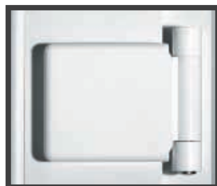
① Haustüren Serie Stabil sind mit 3 verstellbaren, 2-teiligen Bändern ausgestattet.