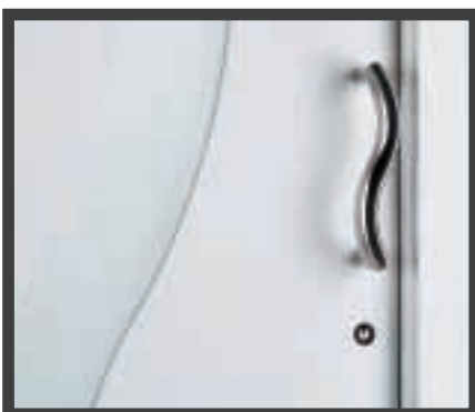
Haustür Serie Exclusiv mit flügelüberdeckender Füllung (51 mm) der Modellreihe Plan

Ob mit Füllungen aus Kunststoff oder Aluminium, als K-Modell oder als Exclusiv-Planmodell: Knipping-Türen bieten eine große Bandbreite an Gestaltungsmöglichkeiten, die für alle Wünsche offen sind und Ihrer individuellen Phantasie freien Raum lassen.