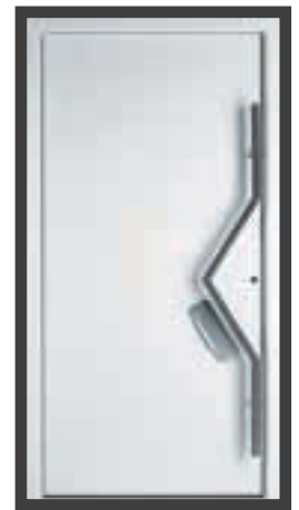
Modellreihe Plan der Serie Exklusiv mit flügelüberdeckenden Füllungen.