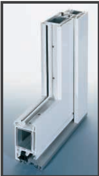
Profilschnitt Aluminium-Haustür Serie TOP