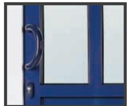
Haustür Serie Stabil, Modellreihe K (als Alu-Color-Ausführung)